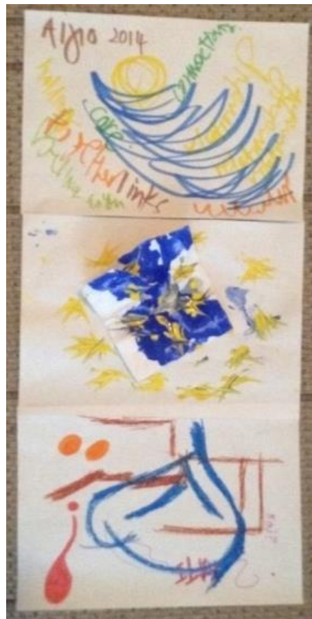
Σύνθεση 3: Νερό

Καθώς η ομάδα μας εξελισσόταν αρχίσαμε να αναζητάμε την ταυτότητά της. Κύριο στοιχείο της ομάδας είναι το παιχνίδι μέσα από το οποίο γνωριστήκαμε και συνεχίζουμε να γνωριζόμαστε. Το στοιχείο του ρευστού (όπως το διακρίναμε στη Σύνθεση 3 που τιτλοφορείται «Νερό») αποτυπώνει ένα κομμάτι της ταυτότητας το οποίο δεν είναι παγιωμένο. Η ομάδα παραμένει δυναμική και ενεργητική συνεχίζοντας τη διηλεκτική διαδικασία προσδιορισμού της, κάτι που αναγνωρίζουμε στο κεντρικό σημείο της Σύνθεσης 3.