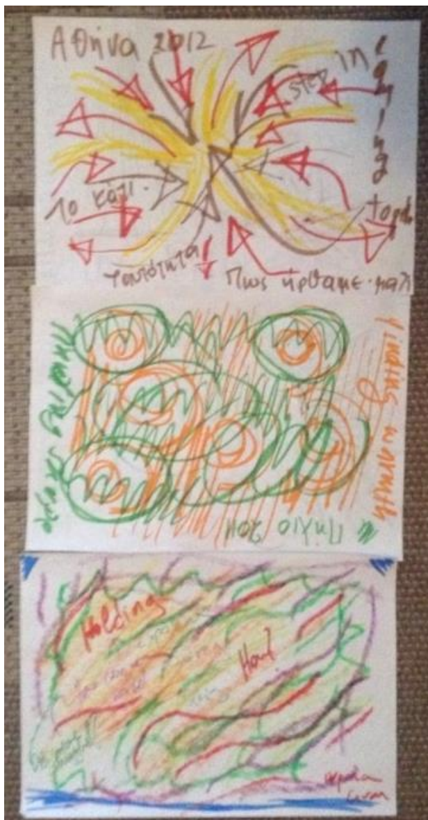
Σύνθεση 8: Πολλαπλότητα

«Ευχαριστώ για την ευκαιρία που μου δώσατε να δω τη ζωή από μία άλλη οπτική γωνία και να ανακαλύψω περισσότερο τον εαυτό μου. Είμαι ευγνώμων.» 6