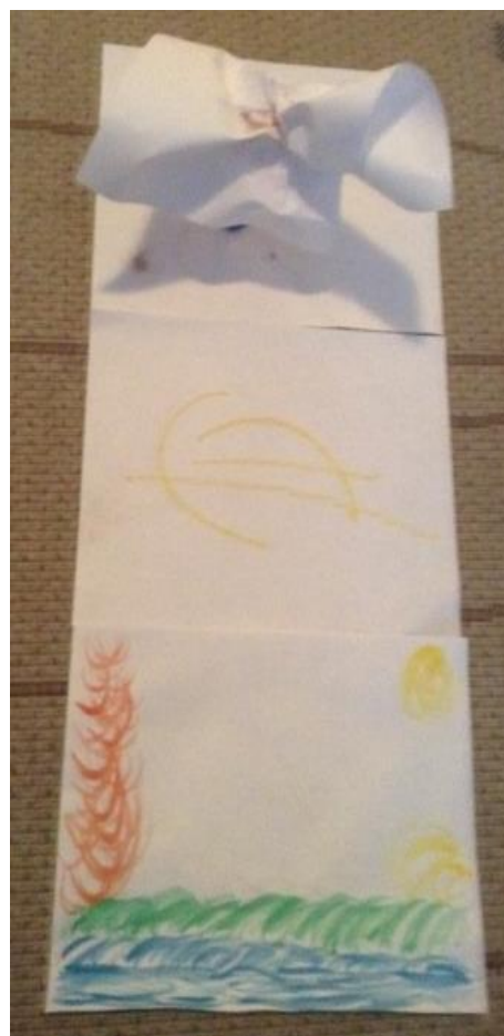
Σύνθεση 1: Αέρας

Η συμμετοχή μας στην ομάδα ξεκινάει από τις έννοιες του άδειου χώρου και του ανοιχτού ορίζοντα, όπως αποτυπώνονται στην Σύθεση 1 που τιτλοφορείται «αέρας». Η κοινή επιθυμία των μελών της ομάδας να συνεργαστούν με θεραπευτές