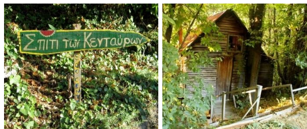
Εικόνα 1: Το Σπίτι των Κενταύρων, Ανήλιο Πηλίου

Το φεστιβάλ έλαβε μέρος στις 22-29 Ιουλίου 2011 στο μη-κερδοσκοπικό Κέντρο Ολιστικής Εκπαίδευσης «Το Σπίτι των Κενταύρων» στο Ανήλιο Πηλίου (Εικόνα 1). Το φεστιβάλ είχε χαρακτήρα εισαγωγικού σεμιναρίου που συμπεριέλαβε ομιλίες, δημιουργικά εργαστήρια καθώς και καλλιτεχνικές δράσεις δίνοντας ισάξια έμφαση τόσο στη θεραπευτική όσο και στην καλλιτεχνική διάσταση των τεχνών (Εικόνα 2).