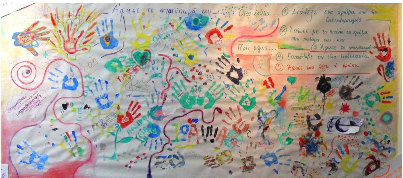
Εικόνα 4: Δημιουργική ανατροφοδότηση-αποτύπωμα των συμμετεχόντων (Αθήνα, 2012)

Αυτή η δεύτερη δράση της ομάδας έπαιξε καθοριστικό ρόλο στην εδραίωσή της: επιβεβαιώθηκε η λειτουργία της ομάδας, το κοινό της όραμα, και ορισμένες από τις βασικές της αξίες όπως ο σεβασμός μεταξύ των διαφορετικών θεραπευτικών προσεγγίσεων, ο συνδυασμός πράξης, θεωρίας και έρευνας, το κοινό ενδιαφέρον για συνεργασία και σύμπραξη των θεραπειών μέσω τεχνών σε επαγγελματικό, ερευνητικό και πρακτικό επίπεδο. Το Μάιο του 2012, επίσης, η ομάδα απέκτησε λογότυπο (Εικόνα 5), και σε μια προσπάθεια αυτοπροσδιορισμού της προέκυψε η ονομασία «ΚΑΤΙ».