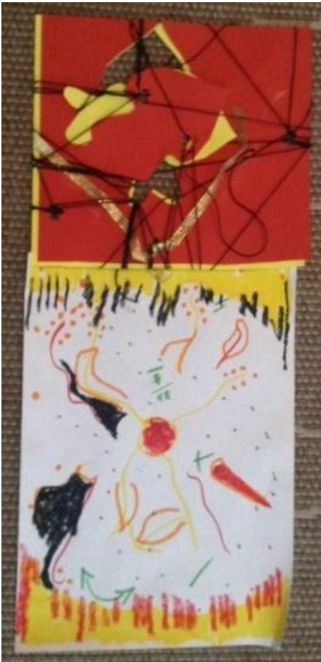
Σύνθεση 4: Φωτιά

Αναζητώντας αυτά και άλλα παρόμοια ερωτήματα, αισθανθήκαμε ότι ο πυρήνας δεν στηρίζεται στα άτομα, αλλά στην ιδέα και το όραμα της ομάδας. Αυτό αναγνωρίσαμε και στη Σύνοψη 5 όπου φαίνονται σχέδια με ανοιχτούς και κλειστούς κύκλους που άλλοτε έχουν πυρήνα κι άλλοτε όχι, ή