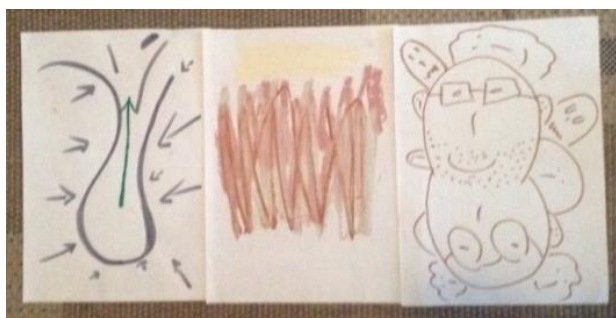
Σύνθεση 6: Μοντέλα

Εδώ γίνεται αναφορά στο πώς η ομάδα ΚΑΤΙ επικοινωνεί τις διάφορες θεωρητικές πτυχές των θεραπειών μέσω τεχνών ή τα διαφορετικά «μοντέλα». Έχοντας ως βίωμα το διήμερο σεμινάριο της Αθήνας –όπου δόθηκε ιδιαίτερη έμφαση σε θεωρητικές και ερευνητικές διαστάσεις των θεραπειών μέσω τεχνών– αναρωτηθήκαμε πώς θα μπορούσαμε να ισοροπήσουμε τη βιωματική με τη θεωρητική γνώση (αριστερή εικόνα στο τρίπτυχο της Σύνθεσης 6). Επίσης, γίνεται αναφορά στην ενσωμάτωση διαφορετικών θεωρητικών και θεραπευτικών προσεγγίσεων τις οποίες πρεσβεύουν τα μέλη της ομάδας (μεσαία εικόνα στο τρίπτυχο της Σύνθεσης 6). Χαρακτηριστική είναι η μορφή των πολλαπλών προσώπων (δεξιά εικόνα στο τρίπτυχο της Σύνθεσης 6) που μπορεί να διακρίνει ο παρατηρητής από διαφορετικές πλευρές.