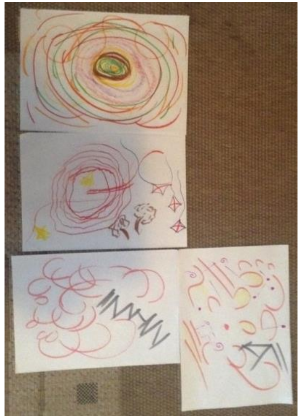
Σύνθεση 5: Κύκλοι