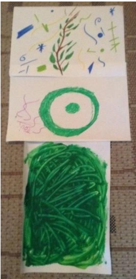
Σύνθεση 2: Γη

Κοινό βίωμα ανάμεσα στα μέλη της ομάδας ήταν η επιθυμία μας να μοιραστούμε και να προσφέρουμε προσωπικές ιδέες, εμπειρίες και γνώσεις – γεγονός που οδήγησε σε έναν πλούτο υλικού. Η Σύνθεση 2 (Γη) –όπου η μεγάλη ποσότητα πράσινου χρώματος παίρνει σταδιακά μια πιο οργανωμένη μορφή και εξελίσσεται σε ένα φυτό που αναπτύσσεται– νιώθουμε ότι αντανάκλα την πορεία της ομάδας. Κατά τη διάρκεια αυτής της πορείας έχουμε προσπαθήσει να ξεκαθαρίσουμε και να οργανώσουμε το υλικό που διαθέτουμε και να του δώσουμε συγκεκριμένη μορφή ανάλογα με το πλαίσιο της εκόστωτε δράσης της ομάδας. Στο