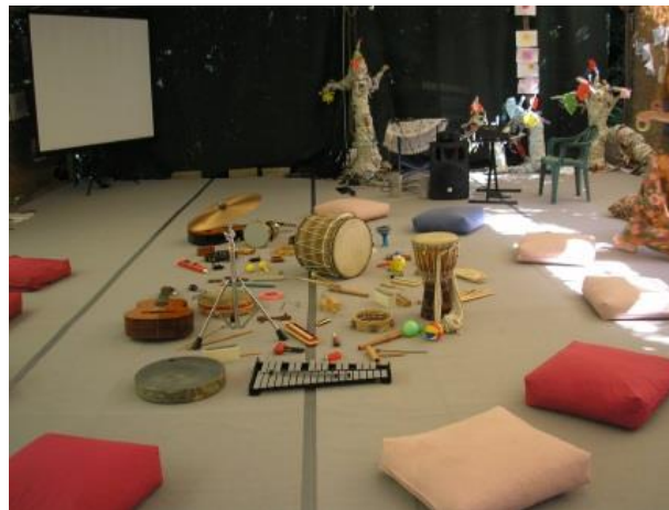
Εικόνα 2: Χώρος διεξαγωγής εργαστηρίων