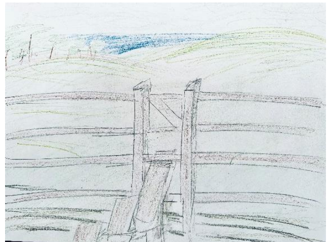
Εικόνα 7: Σχέδιο της Lucy

Χρησιμοποίησα ένα πετάλι επανάληψης φράσης (loop pedal) για να κάνω έναν φωνητικό αυτοσχεδιασμό, αναπτύσσοντας το ένα ηχητικό στρώμα μετά το άλλο ως ανταπόκριση σε αυτές τις προτροπές, μέχρι να γίνει θορυβώδες και χαοτικό και πλήρες. Εντός του ήχου, ο νους μου έπαιξε με την ιδέα της δομικής θυροφύλαξης. Ο τρόπος με τον οποίο εγκαθίστανται τα συστήματα – στο μακρο-επίπεδο του παγκόσμιου ακαδημαϊκού χώρου, έως και τις δικές μας εσωτερικευμένες αντιλήψεις για το τι αξίζει και τι είναι «σωστό» – και πώς αυτά τα ίδια τα συστήματα δημιουργούν θύρες που μπορούν τόσο να διευκολύνουν όσο και να περιορίσουν την πρόσβαση σε ακαδημαϊκούς χώρους. Σκέφτηκα τα είδη των θυρών που αντικατοπτρίζονται στην Εικόνα 7, μια ζωγραφιά που σχεδίασα μόνη μου. Θυμήθηκα αυτό το σχέδιο πόρτας και στύλου από εικόνες που είχα δει ως παιδί. Με ενδιέφερε τότε, όπως και τώρα, ο τρόπος με τον οποίο το σκαλοπάτι και η πόρτα παρέχουν μια δίοδο πάνω από έναν φράχτη και στο τοπίο πέρα από αυτόν – όμως μόνο για μερικούς. Για εκείνους