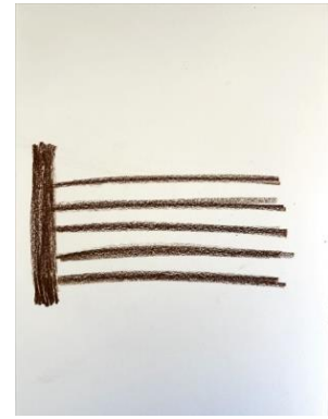
Εικόνα 6: Οι γραμμές της θύρας

Φτιαγμένος από μετάξι, ο ιστός της αράχνης είναι κολλώδης (Εικόνα 4). Συχνά τα μακριά υφάδια μεταξύ των κλαδιών δεν είναι ορατά στους ανθρώπους, και αν τύχει να περάσετε μέσα από ένα, το υφάδι σπάει και πιθανότατα μέρος αυτού θα παραμείνει στα ρούχα ή το σώμα σας – αν και παρατηρώ ότι η αίσθησή του είναι εκείνο που μου μένει. Η σχοινοειδής αιώρα που δημιουργούν οι αράχνες για να πιάσουν έντομα φαίνεται ένα παροδικό είδος φραγμού με θανάσιμο σκοπό, και ίσως κάπως απομακρυσμένο από την ακαδημαϊκή ανθρώπινη οικολογία. Απολαμβάνω τη συνοχή και τα νήματα της σύνδεσης, αλλά η εμπειρία τού να βρίσκεσαι στη μέση ενός ιστού που δεν γνώριζες ότι υπήρχε, και οι αόρατες/ορατές γραμμές μου θυμίζουν την εμπειρία μου με ακαδημαϊκούς κανόνες, συνήθειες και ιεραρχίες γνώσης.