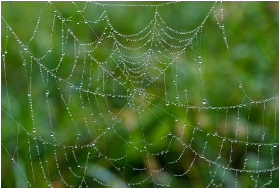
Εικόνα 4: Ένας ιστός αράχνης