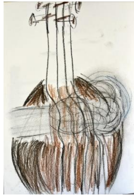
Εικόνα 5: Ο αέρας μέσω των χορδών