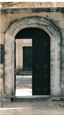
Εικόνα 1: Πόρτα που ανοίγει και κλείνει