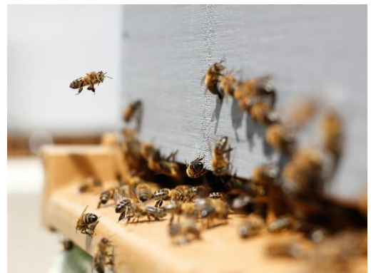
Εικόνα 3: Κυψέλη

Μια πόρτα μπορεί να είναι πολλά πράγματα ταυτόχρονα.